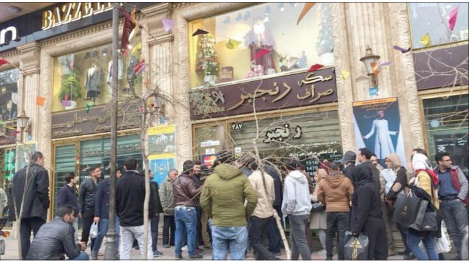
بانک مرکزی در تهران

دانشکده اقتصاد دانشگاه خوارزمی در گفتگو با «روزگار» درباره چگونگی وضعیت این روزهای بازار ارز سهمیه ای و اینکه چرا مسئولان برای ساماندهی آن اقدام آنچنانی نمی‌کنند، افزود: با توجه به اختلاف قیمت تومان سود کسب خواهد کرد.