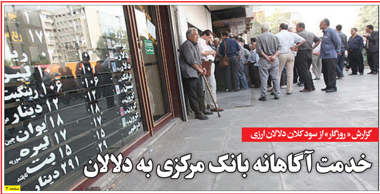
گزارش «روزگار» از سود کلان دلان ارزی