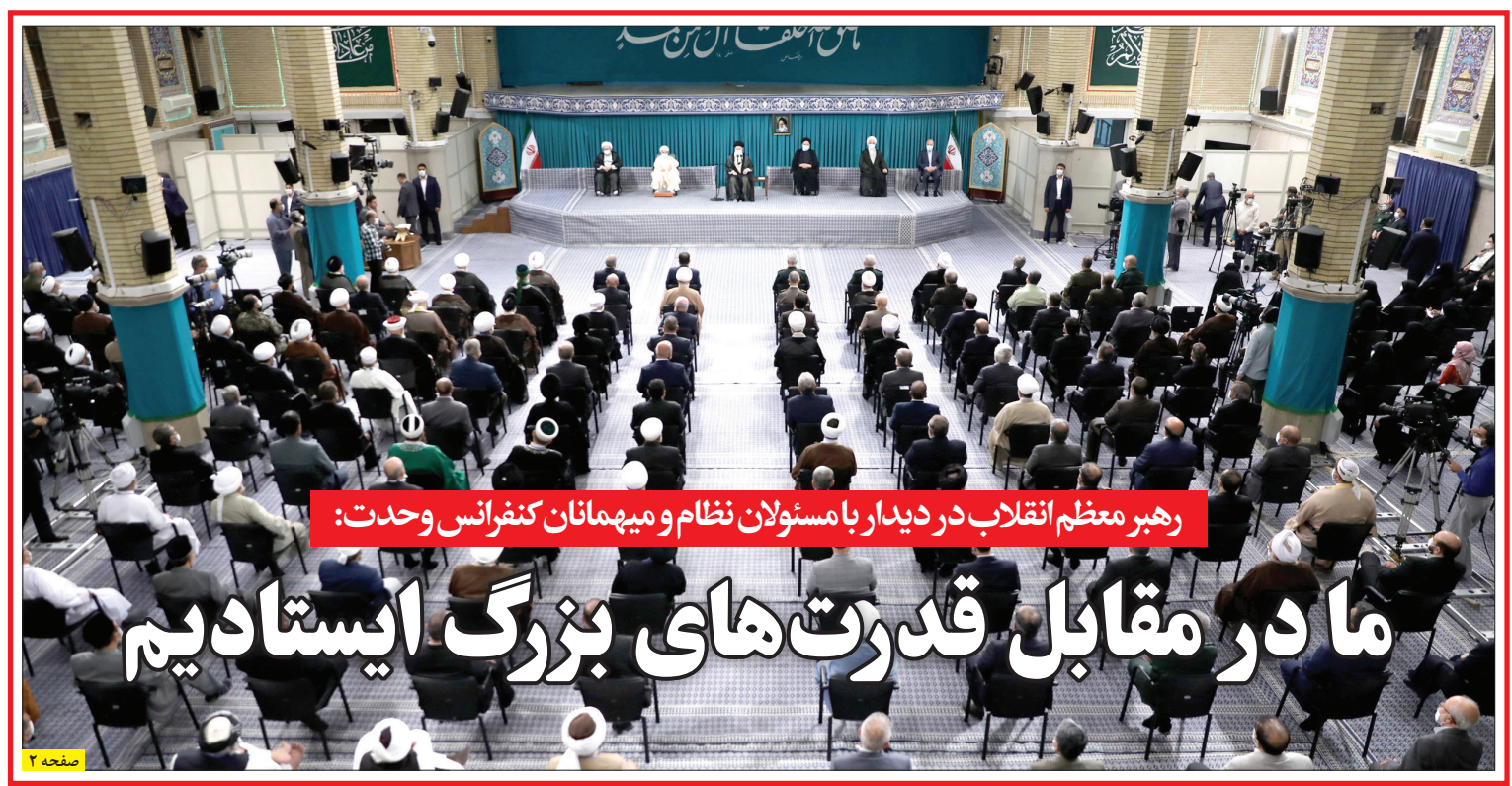
رهبر معظم انقلاب در دیدار با مسئولان نظام و میهمانان کنفرانس وحدت:

توجه به معیشت مردم در شرایطی که نرخ تورم بالاست، مدنظر دولت قرار گرفته است. رئیس جمهور اخیراً با ابلاغ ضوابط مالی ناظر بر تهیه و تنظیم بودجه سال آینده تاکید دارد: همه دستگاه های اجرایی از جمله دستگاه های دارای قوانین خاص در برنامه و بودجه سال