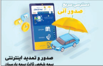
مصور و تمدید اینترنتی بیمه نامه شخص ثالث بیمه پارسیان

بیمه گزاران می توانند جهت صدور بیمه نامه شخص ثالث خود بصورت مستقیم و آنلاین به سایت بیمه پارسیان مراجعه و در زمان کوتاهی نسبت به خرید یا تمدید آن اقدام نمایند.بر اساس این گزارش، بیمه گزاران می توانند جهت صدور بیمه نامه شخص ثالث خود بصورت مستقیم و آنلاین به سایت بیمه پارسیان مراجعه و در زمان کوتاهی نسبت به خرید یا تمدید آن اقدام نمایند.امکان صدور اینترنتی بیمه نامه توسط بیمه پارسیان قبلا نیز فراهم بود که با توجه به تغییراتی در سیستم صدور این شرکت، مدتی این امکان از روی وبسایت شرکت برداشته شده بود که اکنون با راه اندازی سیستم های صدور جدید، بیمه گزاران با دسترسی آسانتر می توانند نسبت به صدور بیمه نامه شخص ثالث و با تمدید بیمه نامه قبلی خود اقدام نمایند.