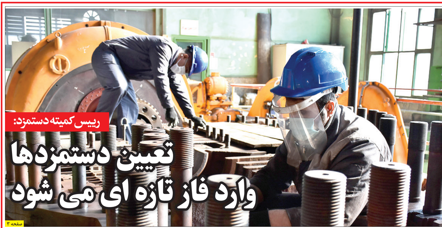
رئیس کمیته دستمزد:

امیرعبداللهیان در خصوص برگزاری شش دوره مذاکرات قبلی ایران با گروه ۴+۱ گفت: ما این مذاکرات را نادیده نمی گیریم، اما به عنوان دولت جدید این حق را برای خود قائل هستیم که با ملاحظات خود مسائل مورد اختلاف را مرور و در مورد آن گفتگو